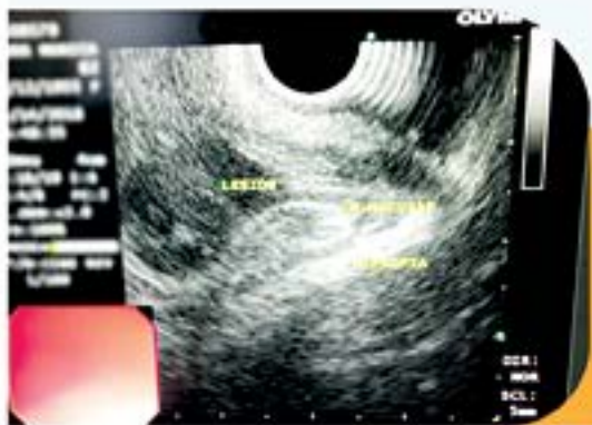
MISMA LESIÓN EN EL EXAMEN POR ECOENDOSCOPIA SE IDENTIFICA COMO HIPORREFINGENTE Y DEPENDIENTE DE LA MUSCULARIS MUCOSAE. SEGURAMENTE UN LEIOMIOMA.