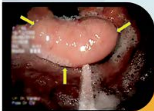
TUMOR SUBMUCOSO SUBCARDIAL VISION ENDOSCÓPICA

MÁS DE 39 AÑOS DE EXPERIENCIA Y CONFIABILIDAD